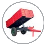
১৫০০ কেজি লিফটিং