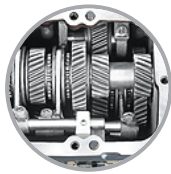
ট্রান্সমিশন কনস্ট্যান্ট মেশ