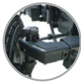
বোঁ-টাইপ ফ্রন্ট এক্সেল