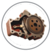
মাল্টি ডিস্ক অয়েল ইমার্সড ব্রেক